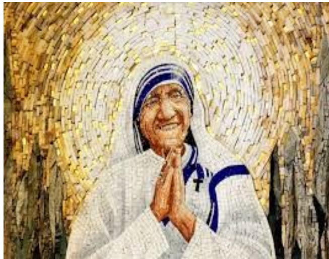
"No es cuánto damos sino cuánto amor ponemos en dar". Santa Teresa de Calcuta